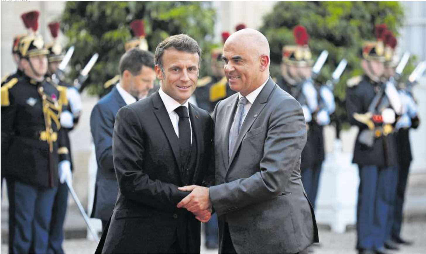
Die Chemie stimmt offenbar: Alain Berset (rechts) und Emmanuel Macron sind sich in letzter Zeit oft begegnet, zuletzt am 22. Juni in Paris.